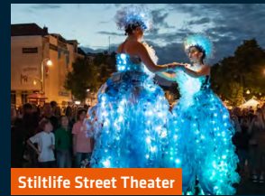
Stilllife Street Theater