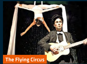
The Flying Circus