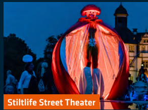
Stilllife Street Theater