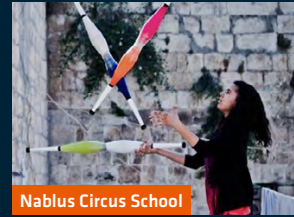
Nablus Circus School