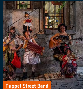
Puppet Street Band